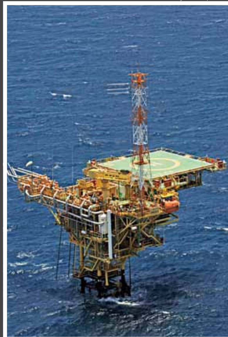
Petróleo e gás Erdöl und Gas