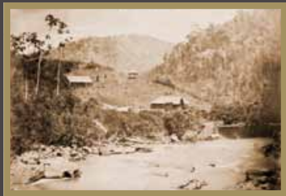
Aspectos da Colônia de Santa Isabel em 1860, por ocasião da visita do Imperador D. Pedro II à Província do Espírito Santo