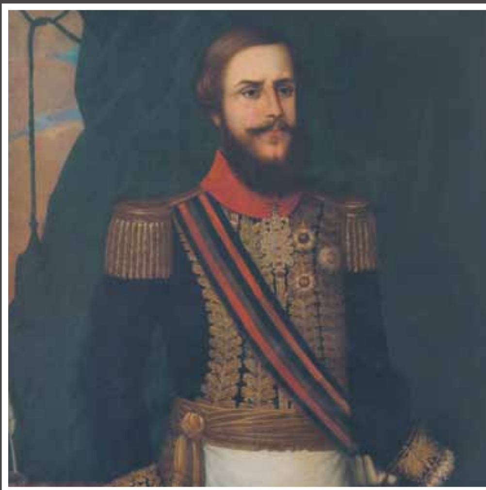
Sob o reinado de D. Pedro II, a política imigrantista atingiu o seu apogeu