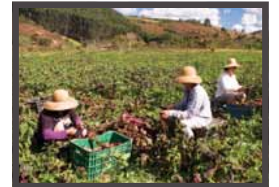
Die Produktion von Ingwer, Eiern und organischen Produkten in Espírito Santo ist dank der Arbeit der deutschsprachigen Einwanderer in ganz Brasilien bekannt