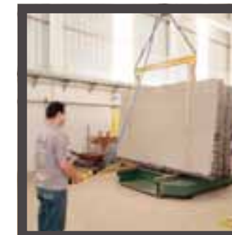
Rochas ornamentais Ornamentsteine