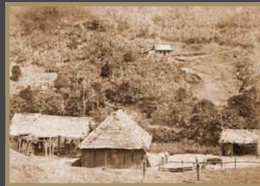
Auf seiner Reise konnte D. Pedro II die mißliche Situation der kaiserlichen Kolonien von Santa Isabel und Santa Leopoldina überprüfen