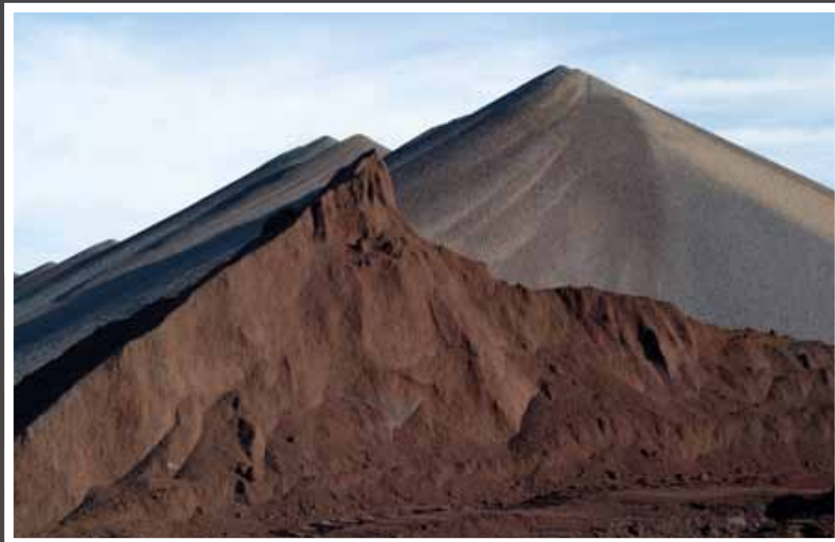
Produção de pellets Produktion von pellets