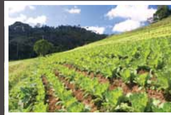
O trabalho dos descendentes germânicos confere destaque nacional à produção capixaba de gengibre, ovos e orgânicos