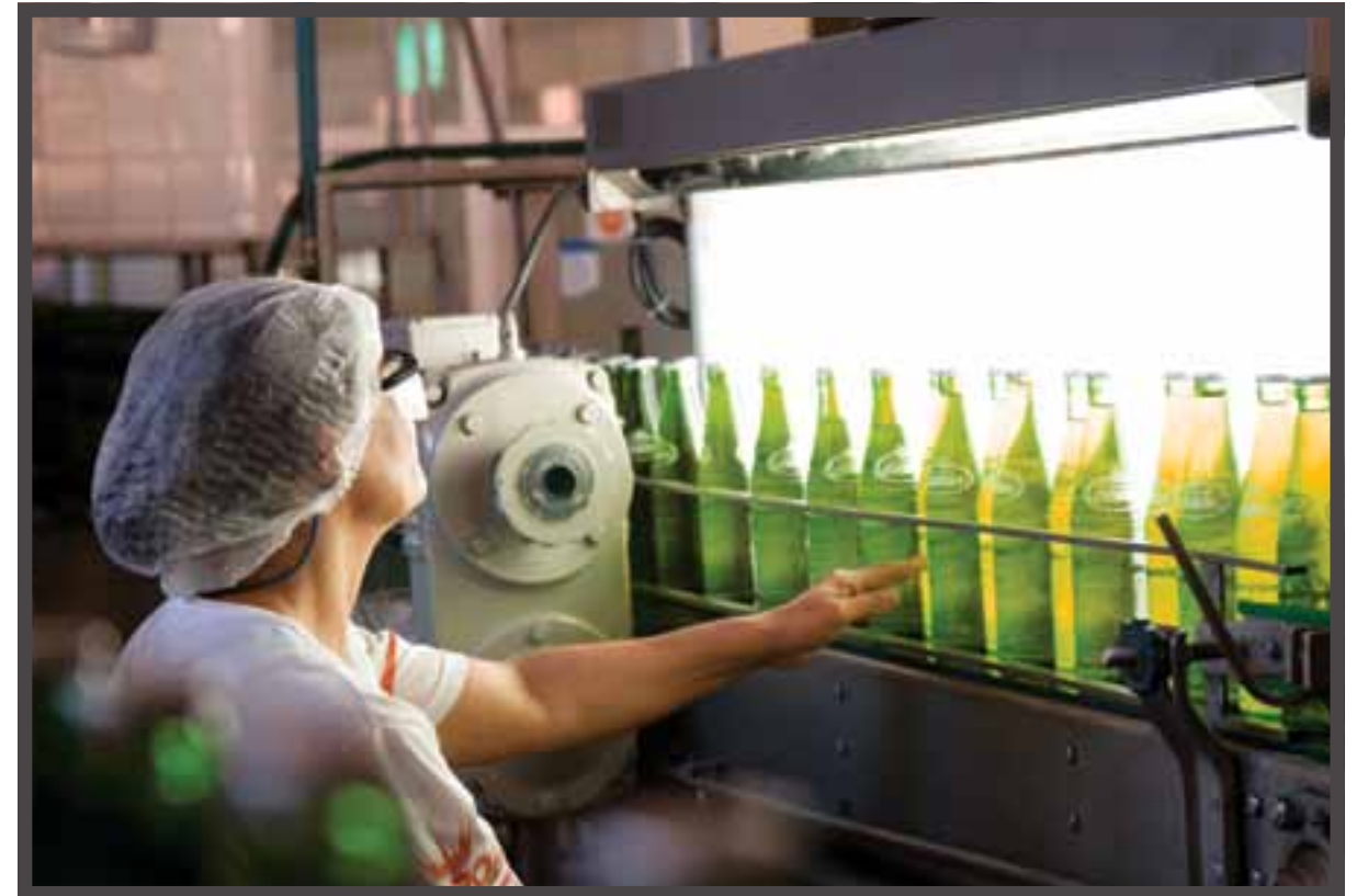
Bebidas e alimentos Getränke und Lebensmittel