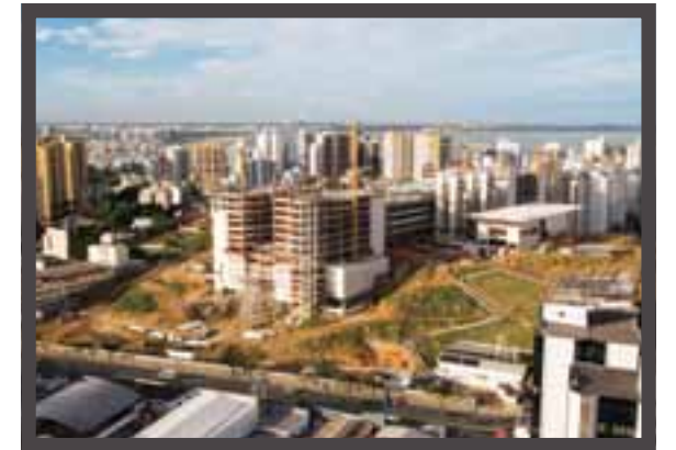
Construção civil Bau