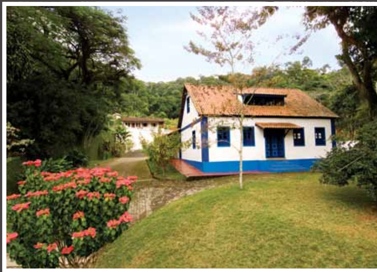
...mas resiste ao tempo e à ocupação urbana, mantendo-se preservada na sede do atual município de Domingos Martins