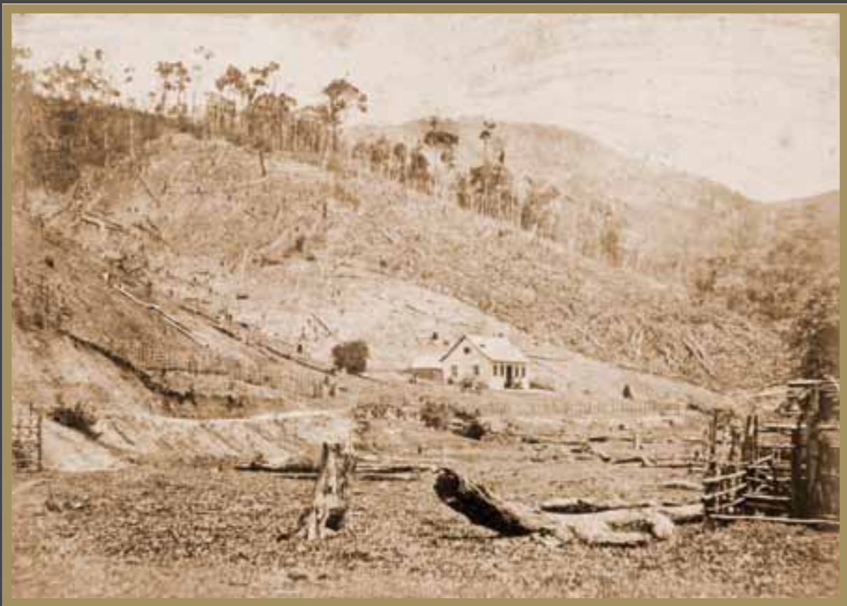
A casa do diretor da Colônia de Santa Isabel, erguida em 1859, foi a primeira construção de Campinho,...