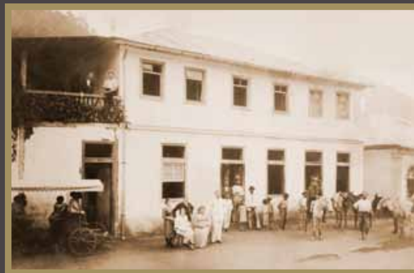
Casa de comércio e hospedaria em uma das primeiras construções da Colônia de Santa Isabel; e os primórdios de Campinho, onde se edificou, pioneiramente, uma igreja protestante com torre no país

Neben dieser Pionierarbeit waren es ebenfalls die Deutschen, die den zweitgrößten Anteil an den im Bun-