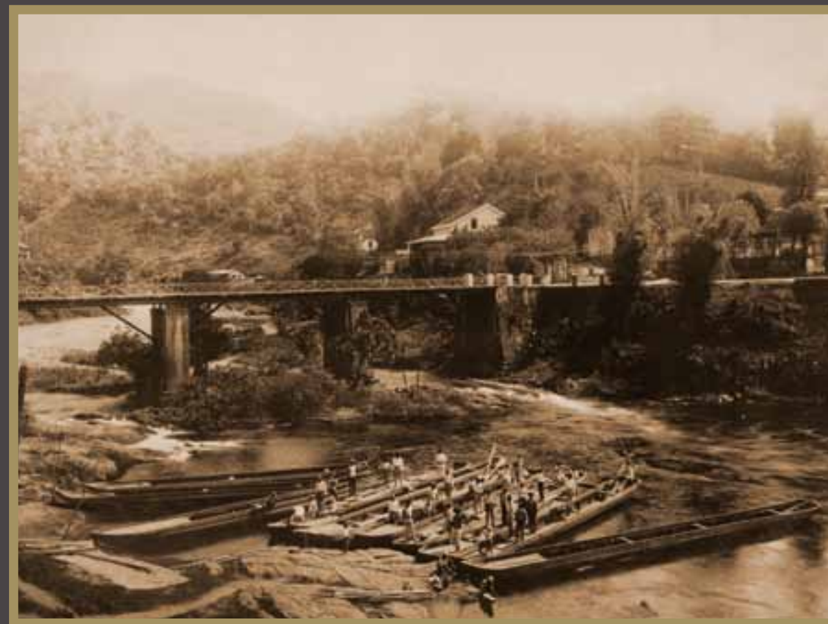
O Porto do Cachoeiro, na Colônia de Santa Leopoldina, foi um dos dinamos da economia capixaba no século XIX